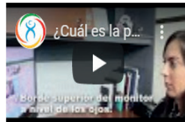
¿Cuál es la postura correcta para trabajar en la oficina?

Esta campaña se desarrolló con amplitud en mensajes en redes sociales, con posteo de mensajes que brindan consejos para mantener la salud en el teletrabajo.