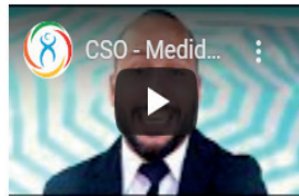
CSO - Medidas para realizar teletrabajo (Parte 2)